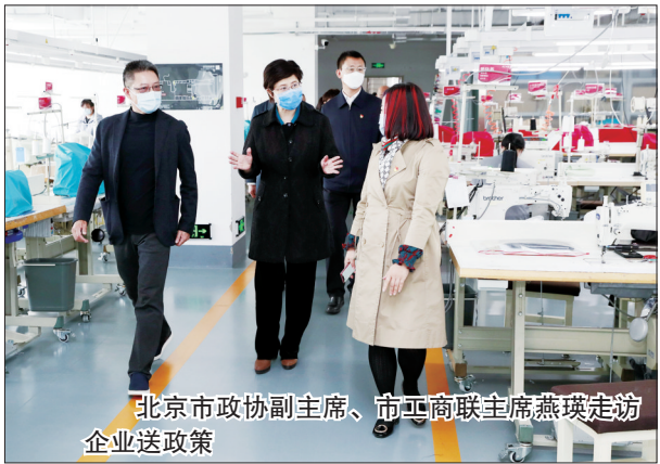
北京市政协副主席、市工商联主席燕瑛走访企业送政策