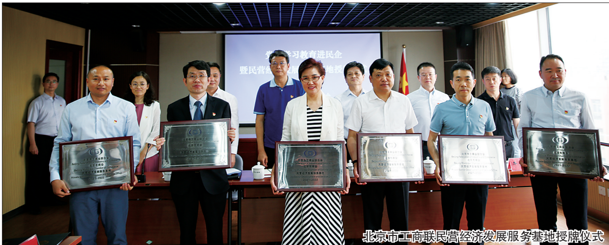
北京市工商联民营经济服务基地授牌仪式

为深入贯彻落实中央“六稳”“六保”决策部署，统筹做好疫情防控和经济社会发展工作，针对疫情全球蔓延的形势变化，聚焦民营企业走出去风险和挑战，全国工商联在系统内开展以“送政策、送服务、防风险”为主要内容的“两送一防”高质量走出去行动，帮助企业科学防控疫情、积极复工复产、防范化解风险，引导服务民营企业高质量参与“一带一路”建设。本报特开辟栏目，陆续刊发各地工商联“两送一防”优秀案例，以飨读者。